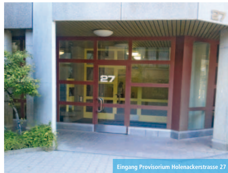
Eingang Provisorium Holenackerstrasse 27

Die Abklärungs- und Trainingsplätze der Versicherten wurden direkt an den Band-Standort Holenackerstrasse 24 verlegt.