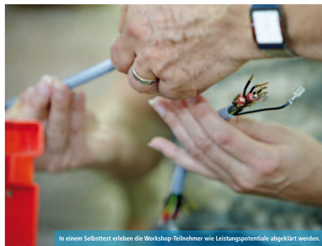
In einem Selbsttest erleben die Workshop-Teilnehmer wie Leistungspotentiale abgeklärt werden.